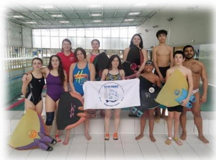
Stage Elite de Février 2023

Deux stages régionaux ont été organisés pendant la saison.