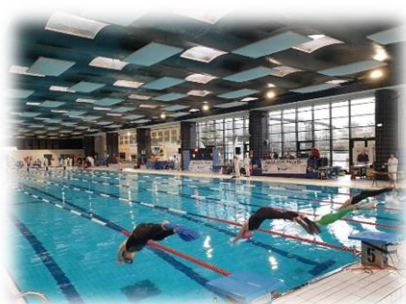
Meeting de Versailles

Début juin nous avons organisé une journée Eau Libre à la base de Beaumont. A une semaine des championnats de France, les nageurs franciliens ont pu profiter de conditions exceptionnelles pour préparer leur compétition grâce à un entraînement collectif et une mise en situation course.