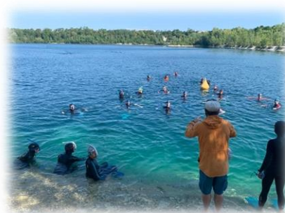
Journée Eau libre IDF à Beaumont