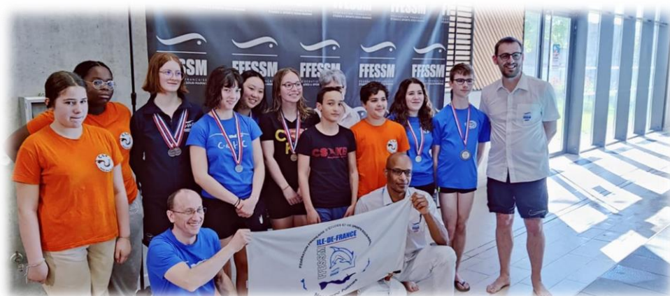
Les nageurs franciliens au championnat de France N2 à Romans sur Isère